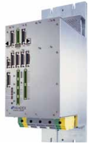
VECTODRIVE® VD600 300A1