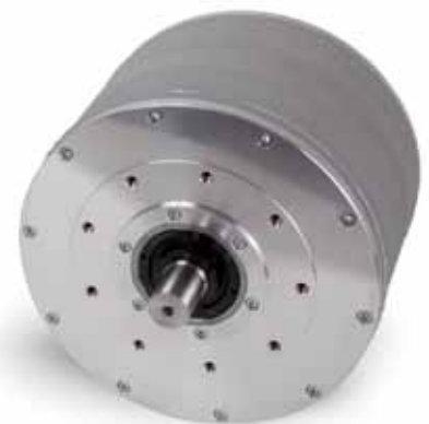
PM-Synchronmotor mit Reluktanznutzung